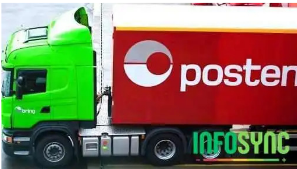
Bring transport pakker og gods narvik alle