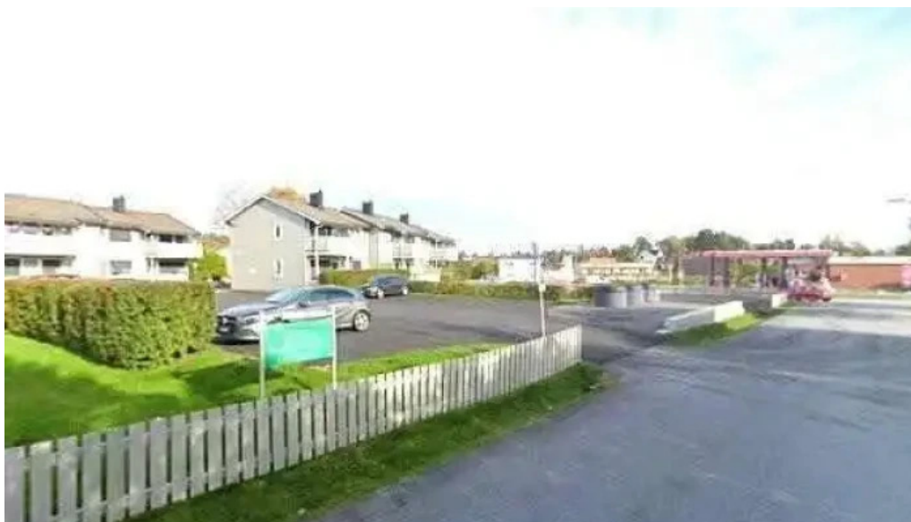
Inter data as alle