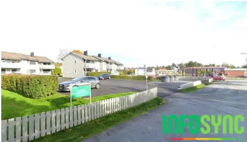
Inter data as halden