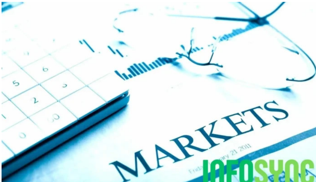
Inter data as fra eieren