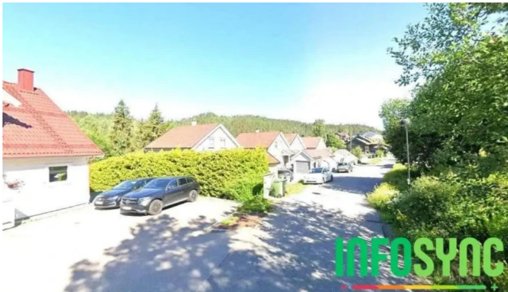
Ask regnskap hagan