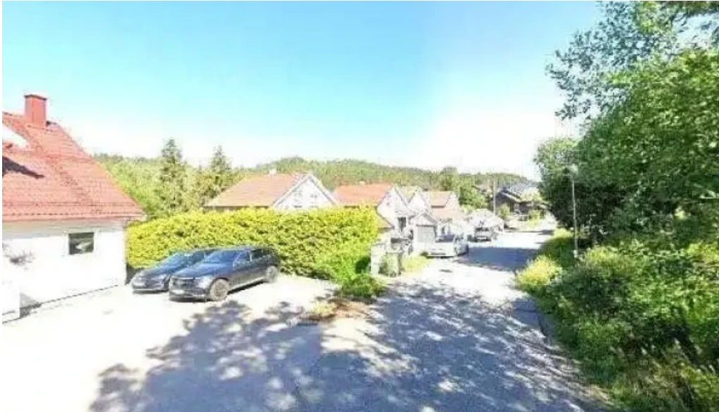
Ask regnskap alle