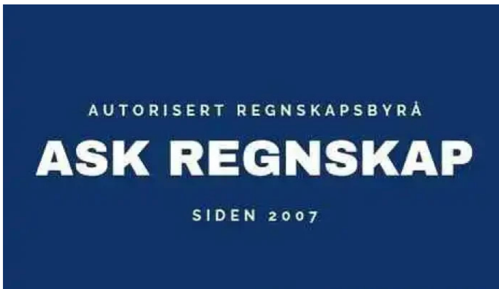
Ask regnskap fra eieren