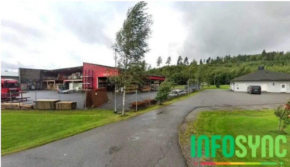
østlid regnskap bjørkelangen