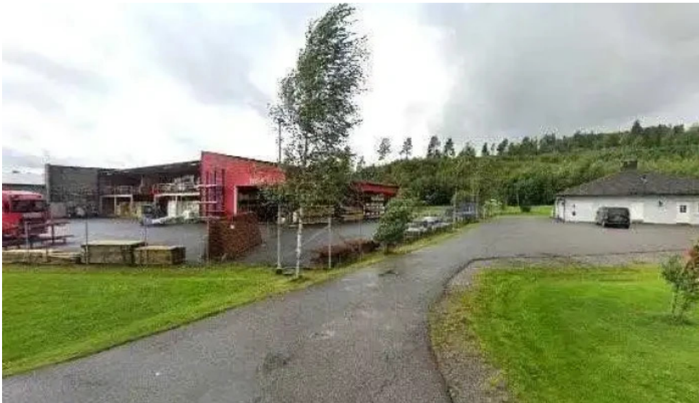
Ostlid regnskap alle