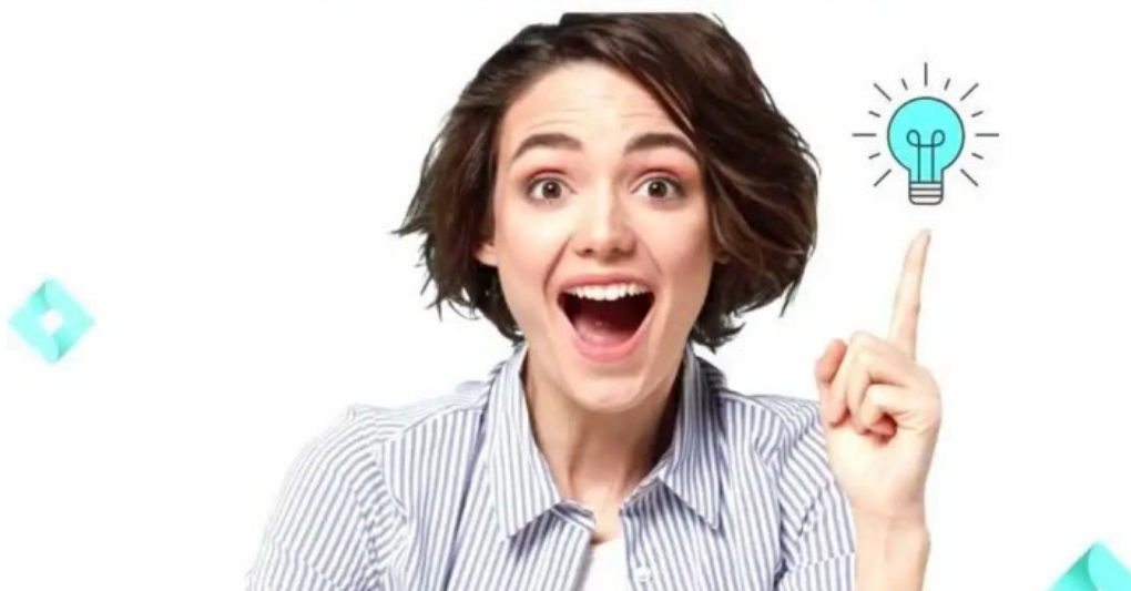
Plm nordic as alle