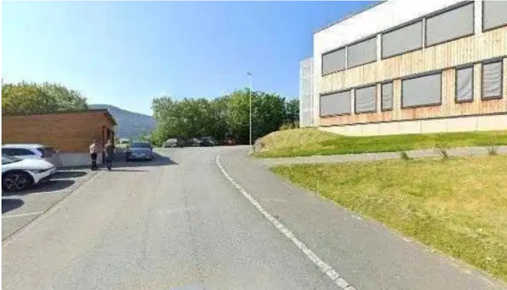
Agdenes legekontor alle