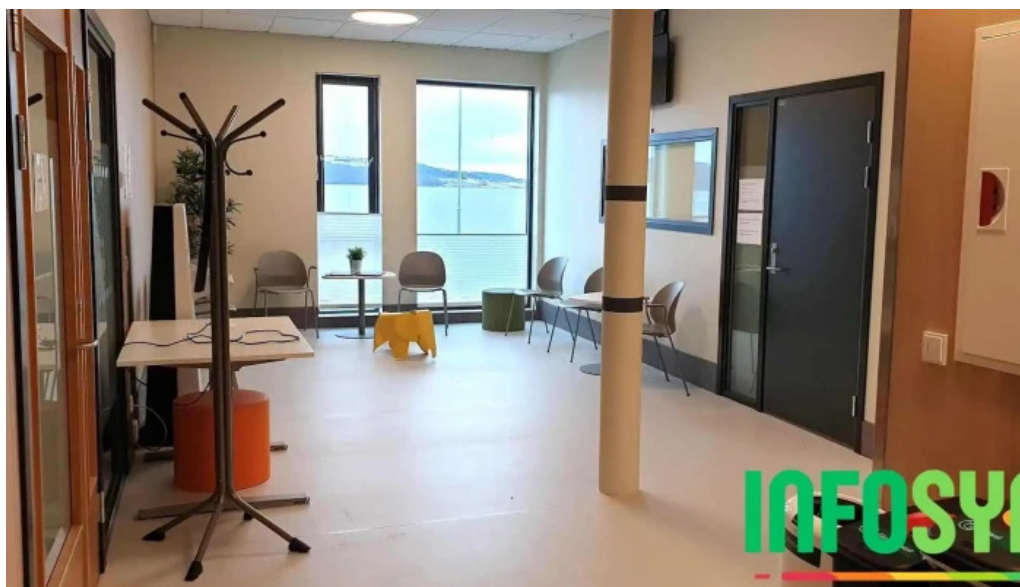
Agdenes legekonsultasjonssenter bygning