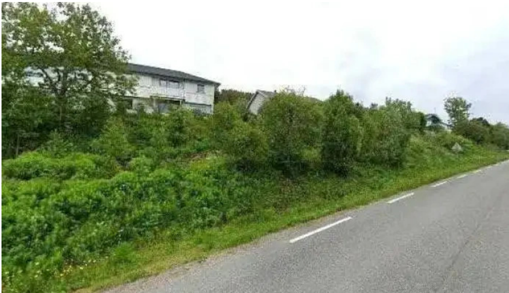
Igeland helsetjenester alle