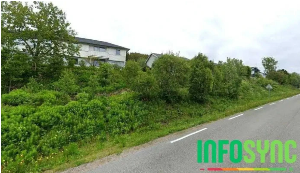
Igeland helsetjenester borkenes