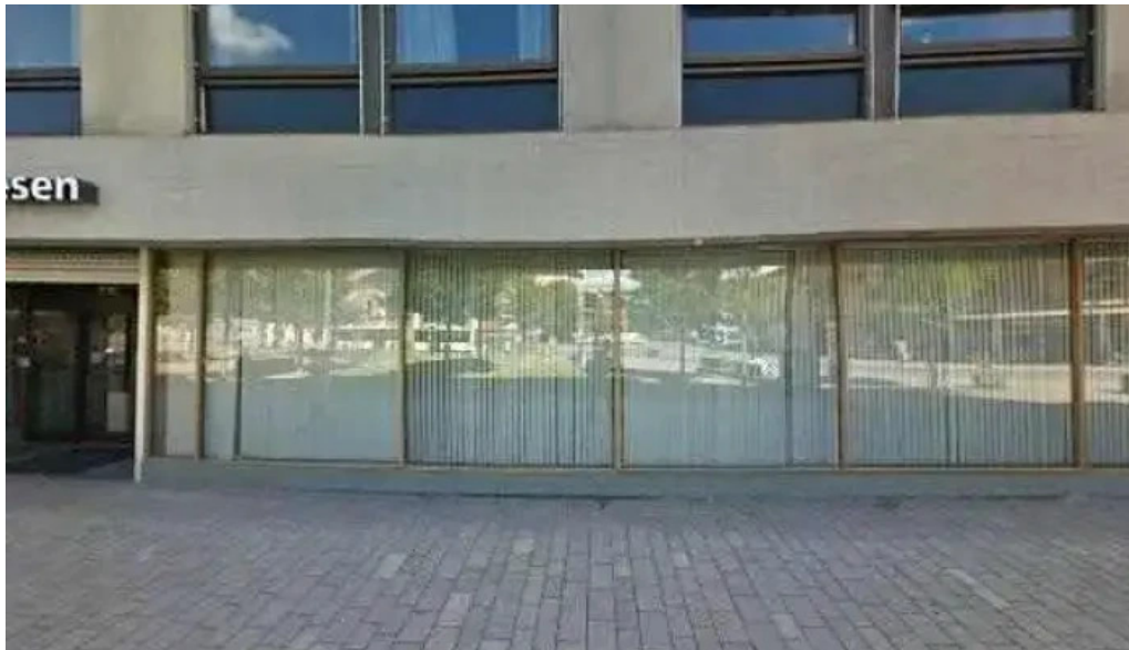
Gjensidige drammen street view 360deg