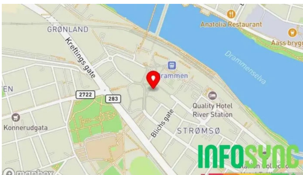
Gjensidige drammen Kart