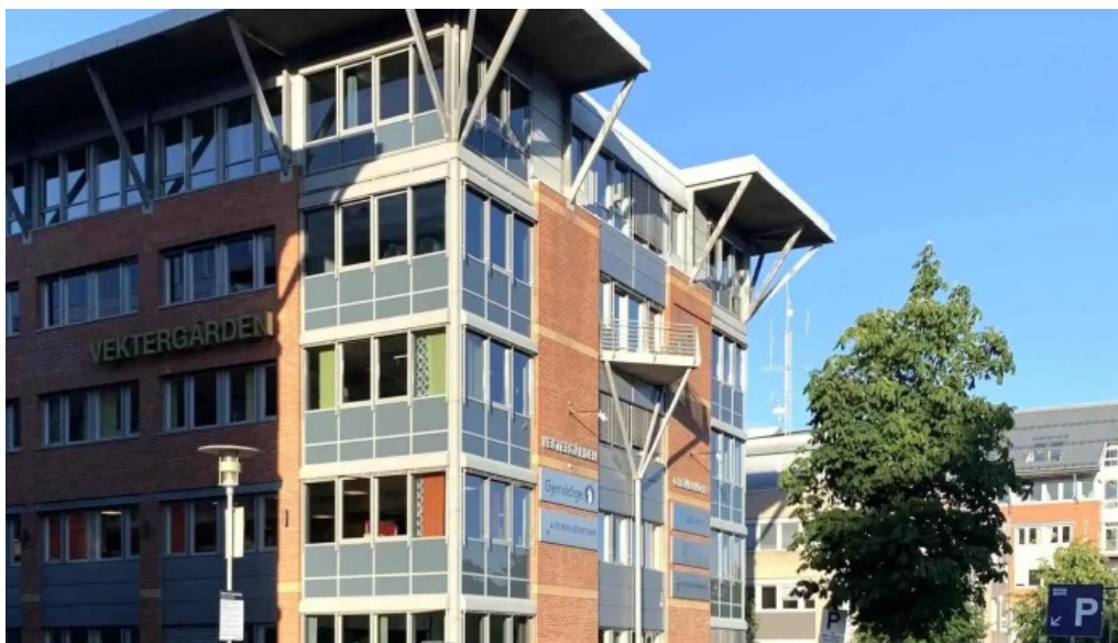
Gjensidige drammen alle