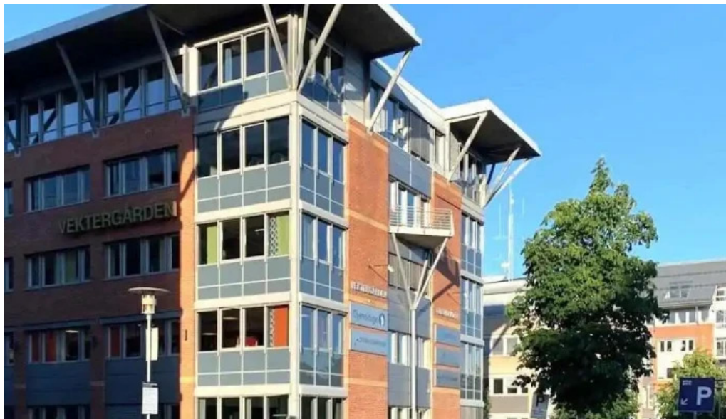
Gjensidige drammen drammen